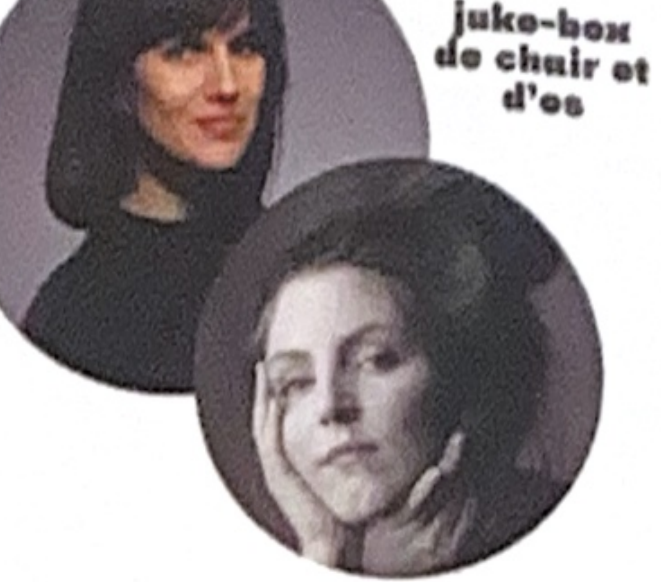
juke-box de chair et d'os

littérature aux Jeux de la francophonie avec le texte La nuit